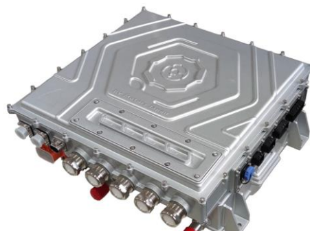
特殊技術の アクティブインバータ