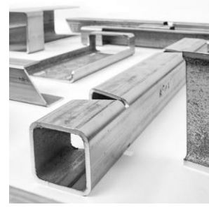
スチールステンレス製 高強度軽量シャーシ