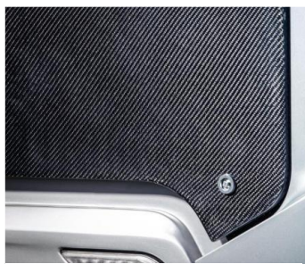
カーボンファイバー製 軽量ボディ