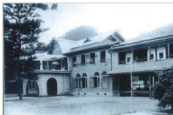
【梅津寺の歴史】 昭和初期の梅津寺温泉。