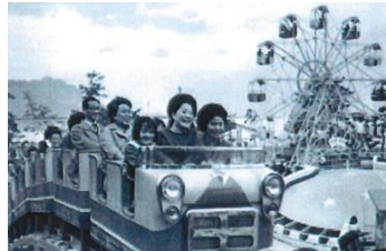
【愛媛新聞社所蔵写真の展示】 昭和38年梅津寺パーク誕生。 大人気のジェットコースター。