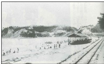
【梅津寺の歴史】 昭和初期の梅津寺海岸。 右の線路が高浜線。