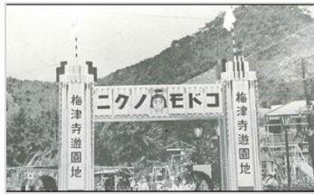
【梅津寺の歴史】 昭和初期の梅津寺遊園地 「コドモノクニ」