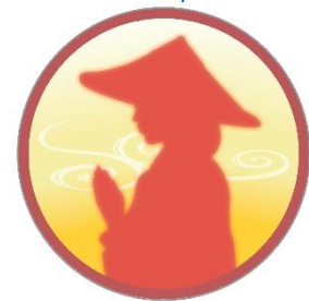
お遍路さんのヘッドマーク