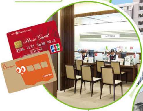
クレジットカード事業 ・損害保険代理店業