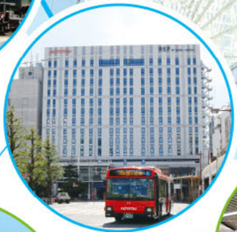
レフ松山市駅 by ベッセルホテルズ