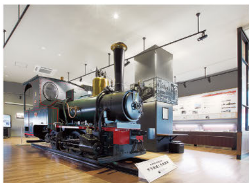
▲伊予鉄の歴史を展示している 「坊っちゃん列車ミュージアム」(松山市駅前)