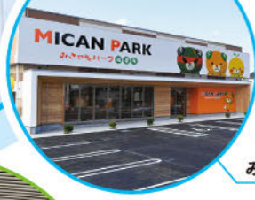
みきゃんパーク梅津寺