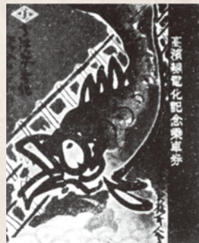
高浜線電化記念乗車券