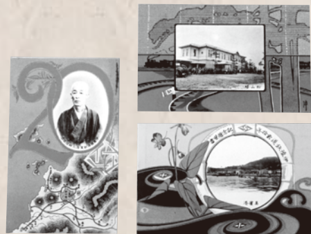
開業20周年記念絵はがき