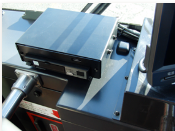
◆ドライブレコーダー車載器