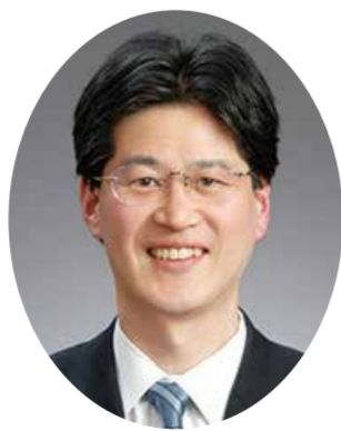
株式会社 伊予鉄グループ 代表取締役社長