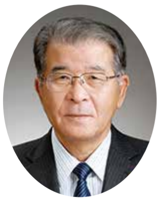
株式会社 伊予鉄グループ 代表取締役会長