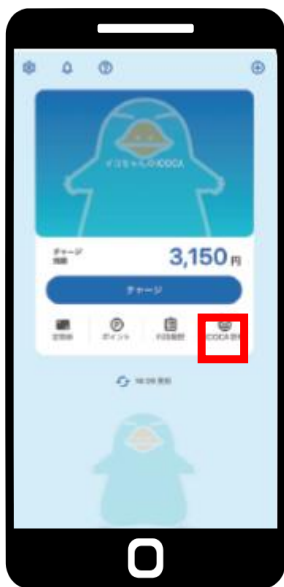
【ICOCA管理】でカード番号確認