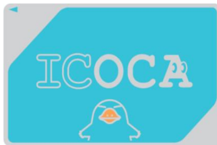
【カード裏面】でカード番号確認

②伊予鉄グループホームページの【ICOCA WEB定期券サービス「iCONPASS」】をクリック