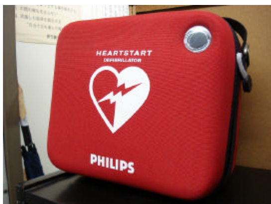
松山市駅に設置されたA E D