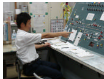
緊急地震速報受信装置運用

平成 19 年 10 月 1 日から一般提供が開催された気象庁の緊急地震速報制度を受け、さらなる安全に寄与する緊急地震速報受信装置を同年 10 月に運転指令所、古町中継所に設置いたしました。緊急地震速報を受信した場合は直ちに列車無線にて停止、減速の通報を実施します。