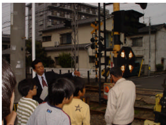
踏切での対処方法を説明