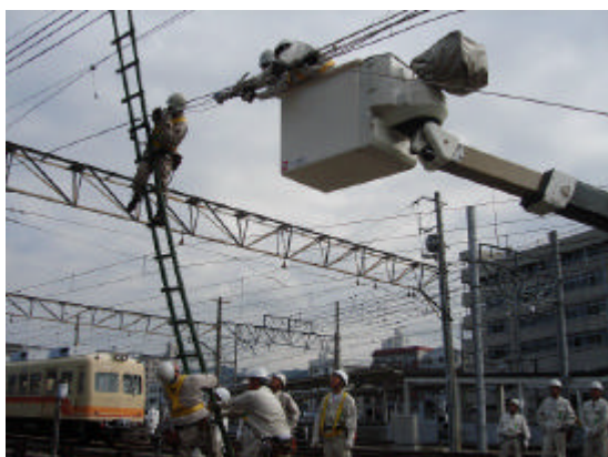
古町駅での架線修復訓練