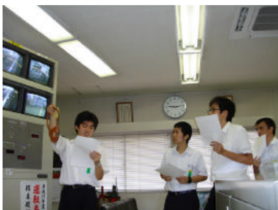
運転指令所での訓練