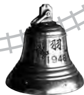
宇高連絡船 鷺羽丸の鐘